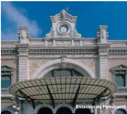
Estación de Ferrocarril

La burguesía industrial, minera y comercial acometió la construcción de sus nuevas residencias de acuerdo con el gusto ecléctico y modernista del fin de siglo XIX, marcando esta profunda renovación el actual carácter del casco antiguo de la ciudad. El arquitecto Víctor Beltrí fue el mejor representante de la corriente modernista en la ciudad con obras como el Asilo de Ancianos, el desaparecido Club de Regatas o La Casa del Niño. Cartagena crece, y pasa al siglo XX derribando parte de las murallas y poniendo en marcha el plan de ensanche en cuadrícula.