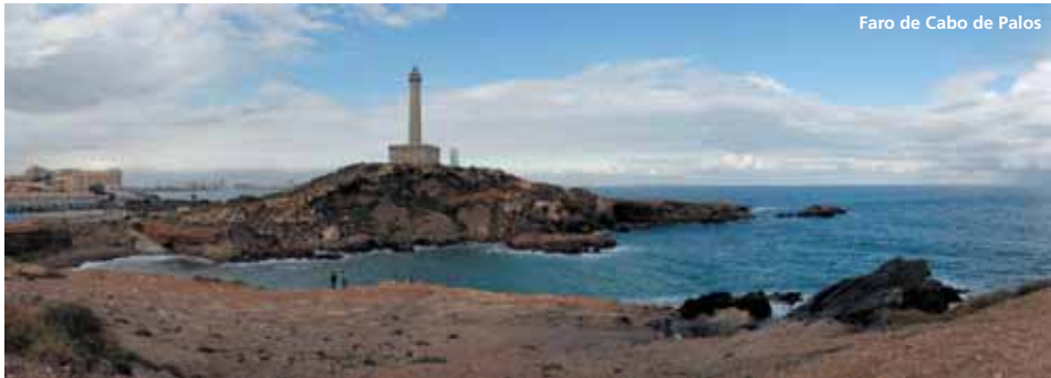
Faro de Cabo de Palos