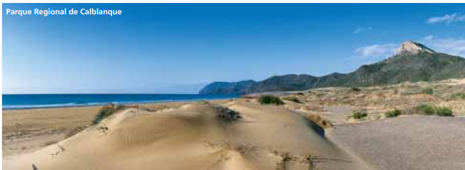
Parque Regional de Calblanque

Cerca se sitúa el Parque Regional de Calblanque, Monte de las Cenizas y Peña del Águila, un paisaje excepcional que se compone de una sucesión de sierras áridas, acantilados y playas. La diversidad de hábitats alberga especies tan singulares de flora como el palmito y la sabina mora. La huella de las culturas humanas que han pasado por aquí permanece en forma de varios elementos de interés como las Salinas del Rasall, un importante humedal para la avifauna acuática, la Batería de Cenizas una antigua batería militar de costa encaramada a la atalaya más privilegiada del parque, o las minas abandonadas que nos recuerdan