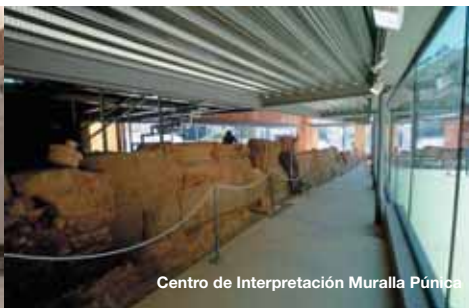
Centro de Interpretación Muralla Púnica

El espacio museístico se ha construido integrando los restos monumentales en el tejido urbano. El teatro fue descubierto de forma casual; la ladera norte de cerro de la Concepción facilitó en su tiempo la