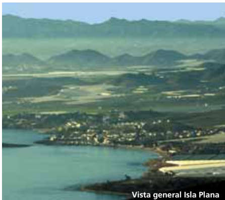
Vista general Isla Plana