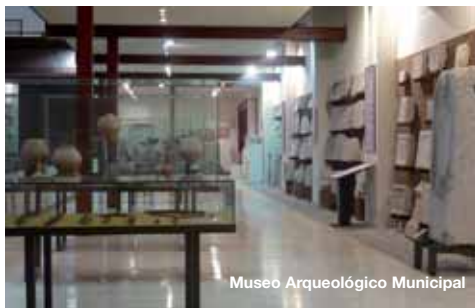
Museo Arqueológico Municipal

Conjunto descubierto en 1957, corresponde a uno de los ejes viarios importantes de la época romana. Se aprecian los restos de una calzada que debía enlazar por la actual calle colindante con una de las antiguas entradas a la ciudad. Los basamentos soportaban un pórtico de tránsito peatonal.