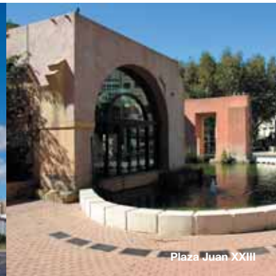
Plaza Juan XXIII