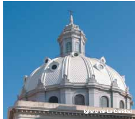
Iglesia de La Caridad

Domina en la construcción la torre rematada por una brillante cúpula y a partir de ella se despliegan dos fachadas profusamente decoradas. El Museo auna el concepto de modernidad en el continente y en el