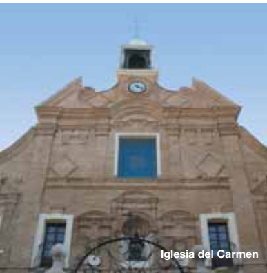
Iglesia del Carmen

Única puerta conservada de las que se construyeron en el S. XVIII en las murallas de Cartagena. En 1865 se le superpuso la torre con el reloj, idéntico al de La Puerta del Sol de Madrid y únicos en España, subrayando más la importancia del espacio al que