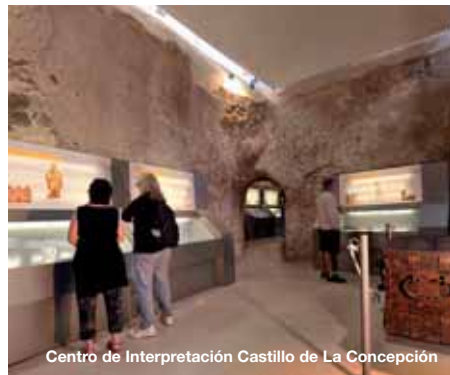
Centro de Interpretación Castillo de La Concepción