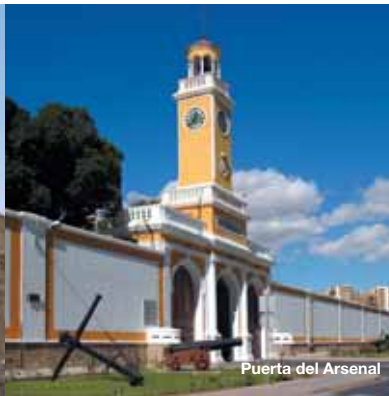
Puerta del Arsenal